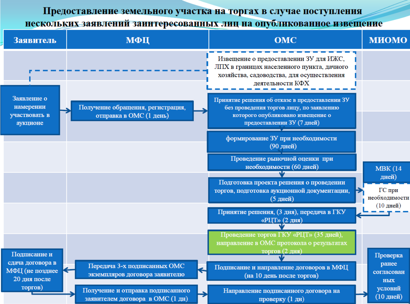
Приложение № 2.1. Блок-схема предоставления государственной услуги