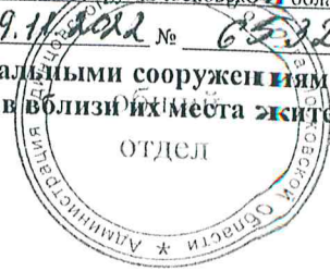
Схема размещения гаражей, являющихся некапитальными сооружениями, стоянок технических или других средств передвижения инвалидов вблизи их места жительства Местоположение/кадастровый №: Московская область, Одинцовский г.о., д. Супонево, кадастровый номер квартала 50:49:0010101 Площадь земельного участка: 1060 кв.м. Категория земель: земли населенных пунктов Вид разрешенного использования: в соответствии с территориальной зоной Обеспечение доступа: земли общего пользования

Утверждена Постановлением Администрации Одинцовского городского округа Московской области от 09.11.2012 № 65/12