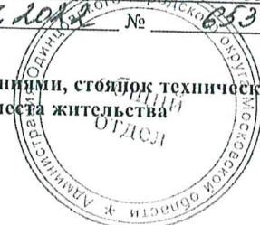
Схема размещения гаражей, являющихся некапитальными сооружениями, стоянок технических или других средств передвижения инвалидов вблизи их места жительства

Утверждена Постановлением Администрации Одинцовского городского округа Московской области от 09.11.2012 № 6533