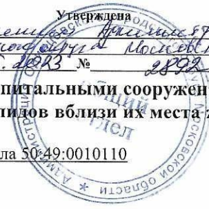
Схема размещения гаражей, являющихся некапитальными сооружениями, стоянок технических или других средств передвижения инвалидов вблизи их места жительства

Утверждена от 14.05.2023 № 2892 Московская область Истринский район Истринский муниципальный округ