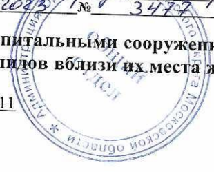
Схема размещения гаражей, являющихся некапитальными сооружениями, стоянок технических или других средств передвижения инвалидов вблизи их места жительства Местоположение/кадастровый №: Московская область, Одинцовский г.о., п. Усово-Тупик, кадастровый номер квартала 50:20:0010411 Площадь земельного участка: 24 кв.м. Категория земель: земли населенных пунктов Вид разрешенного использования: в соответствии с территориальной зоной Обеспечение доступа: земли общего пользования

Утверждена Постановлением Администрации Одинцовского городского округа Московской обл. от 05.06.2015 № 3477