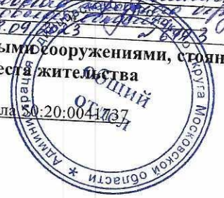
Схема размещения гаражей, являющихся некапитальными сооружениями, стоянок технических или других средств передвижения инвалидов вблизи их мест жительства Местоположение/кадастровый №: Московская область, Одинцовский г.о., г. Звенигород, Звенигородское шоссе, кадастровый номер квартала 50:20:0041737 Площадь земельного участка: 625 кв.м. Категория земель: земли населенных пунктов Вид разрешенного использования: в соответствии с территориальной зоной Обеспечение доступа: земли общего пользования

Утверждена Комиссией по кадастровому делению от 13.09.2013 г. № 1/13/09/003