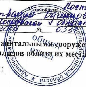
Схема размещения гаражей, являющихся некапитальными сооружениями, стоянок технических или других средств передвижения инвалидов вблизи их места жительства

Администрация района Одинцовского городского округа Московской области от 20.04.2018 № 63/18