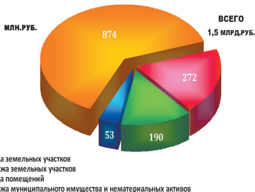
Доходы консолидированного бюджета Одинцовского муниципального района от всех видов использования муниципального имущества

Социально ориентирована бюджетная политика района. Расходы консолидированного бюджета района составили 7 млрд. 716 млн. руб., в том числе 4 млрд. 986 млн. руб. — расходы бюджета Одинцовского муниципального района, из которых почти 87% приходится на социально-культурную сферу, включая образование, здравоохранение, культуру, спорт и социальную поддержку населения.