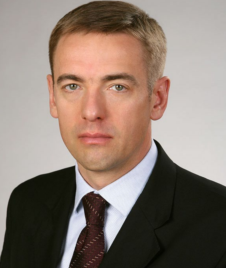
В.Л. Евтухов – статс-секретарь – заместитель Министра промышленности и торговли Российской Федерации