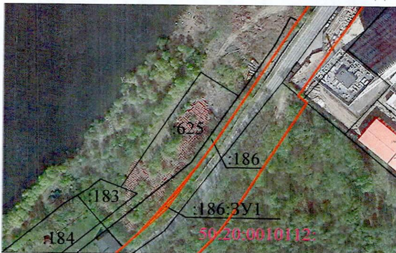
СХЕМА РАСПОЛОЖЕНИЯ ЗЕМЕЛЬНОГО УЧАСТКА ИЛИ ЗЕМЕЛЬНЫХ УЧАСТКОВ НА КАДАСТРОВЫХ ПЛАНАХ ТЕРРИТОРИИ