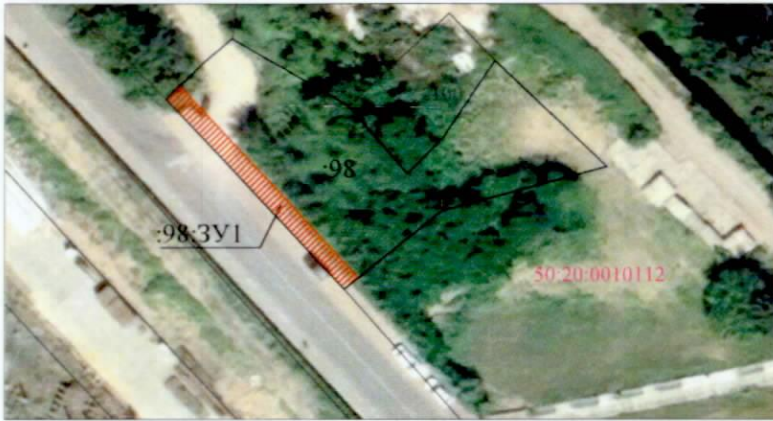
СХЕМА РАСПОЛОЖЕНИЯ ЗЕМЕЛЬНОГО УЧАСТКА ИЛИ ЗЕМЕЛЬНЫХ УЧАСТКОВ НА КАДАСТРОВЫХ ПЛАНАХ ТЕРРИТОРИИ