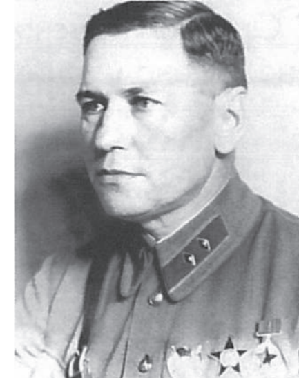
Генерал-лейтенант Осокин В.В. Начальник ГУ МПВО НКВД СССР с 1940 г. по 1950 г.

1937 – 1938 гг. – исполняющий обязанности начальника управления ПВО РККА комдив Блажевич И.Ф.