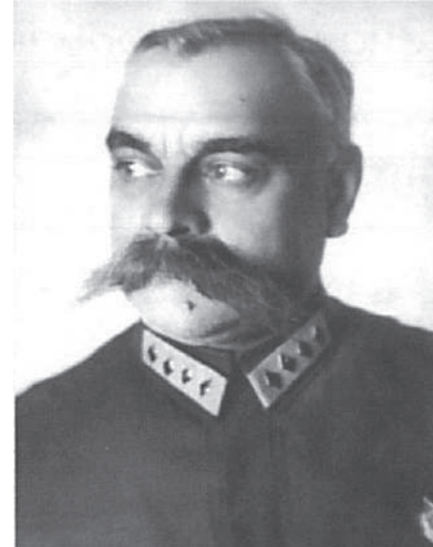
Командарм первого ранга Каменев С.С. Начальник управления ПВО РККА (МПВО) с 1934 г. по 1936 г.