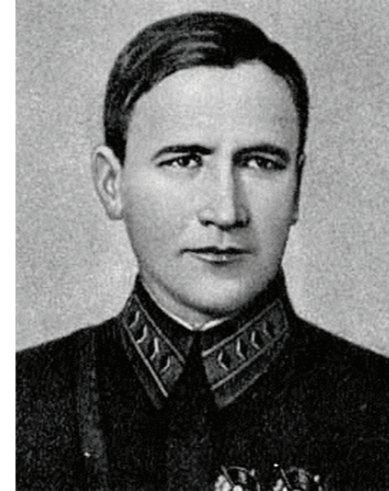
Командарм 2-го ранга Седякин А.И. Начальник управления ПВО РККА (МПВО)