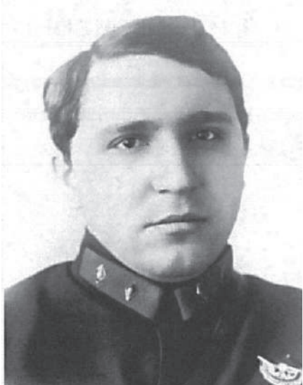
Комдив Медведев М.Е. Первый начальник МПВО с 1932 г. по 1934 г.