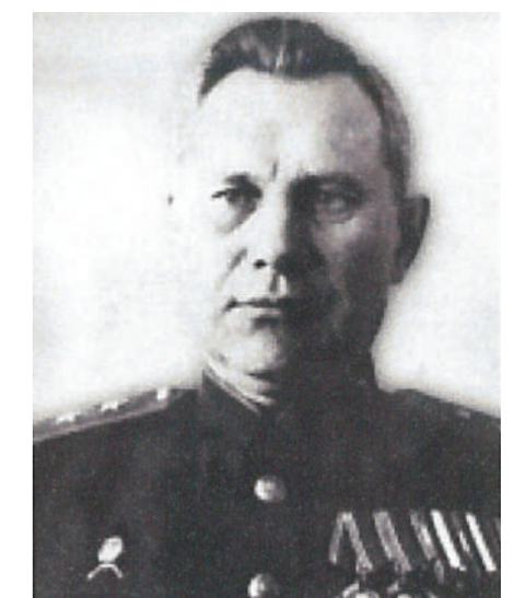
Генерал-лейтенант Королёв М.Ф. Начальник МПВО г. Москвы с августа 1942 г. до конца войны

За годы войны на тыловые объекты страны совершено 659 445 вражеских самолётовывлетов, в ходе которых сброшено около 600 тысяч фугасных и около 1 миллиона зажигательных авиабомб .