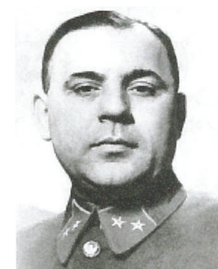
Комбриг Фролов С.Ф. Начальник МПВО г. Москвы с 1940 г. по 1942 г.