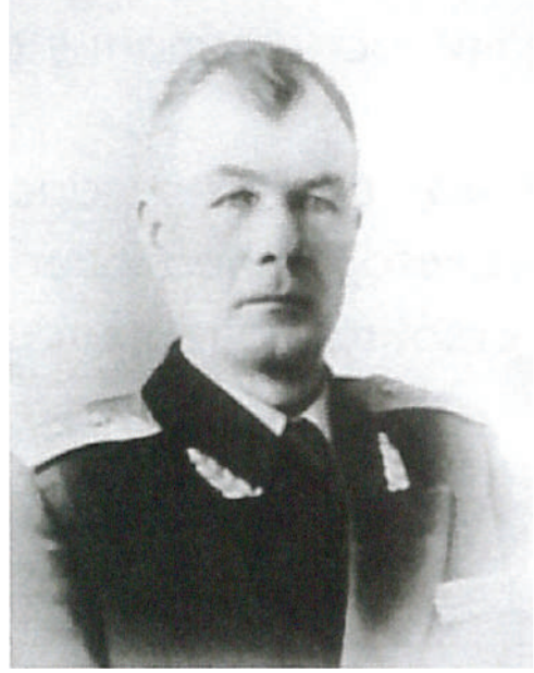
Генерал-лейтенант Шередега И.С. Начальник ГУ МПВО МВД СССР с 1950 г. по 1956 г.