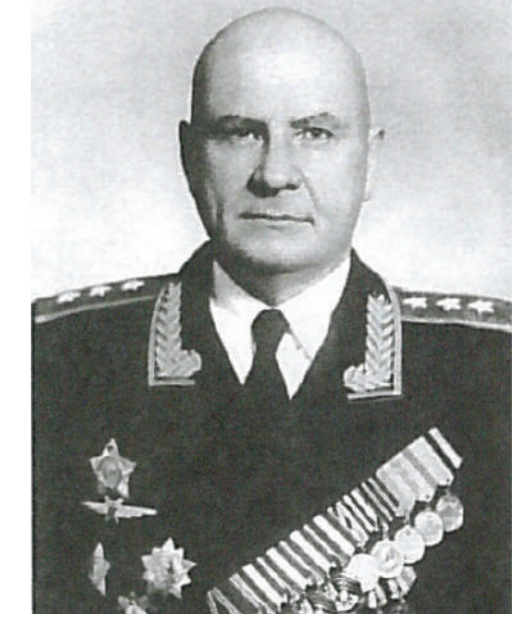
Генерал-полковник авиации Толстикова О.В. Первый заместитель Министра внутренних дел СССР по МПВО с 1956 г. по 1961 г.

5-6 октября 1948 года произошло землетрясение в столице Туркмении г. Ашхабаде, в результате которого число погибших составило свыше 176 000 человек. 240 тяжелых транспортных самолетов МПВО доставили в Ашхабад 1 265 медиков, 48 тонн медикаментов, 240 тонн продуктов, 5 тысяч армейских палаток.