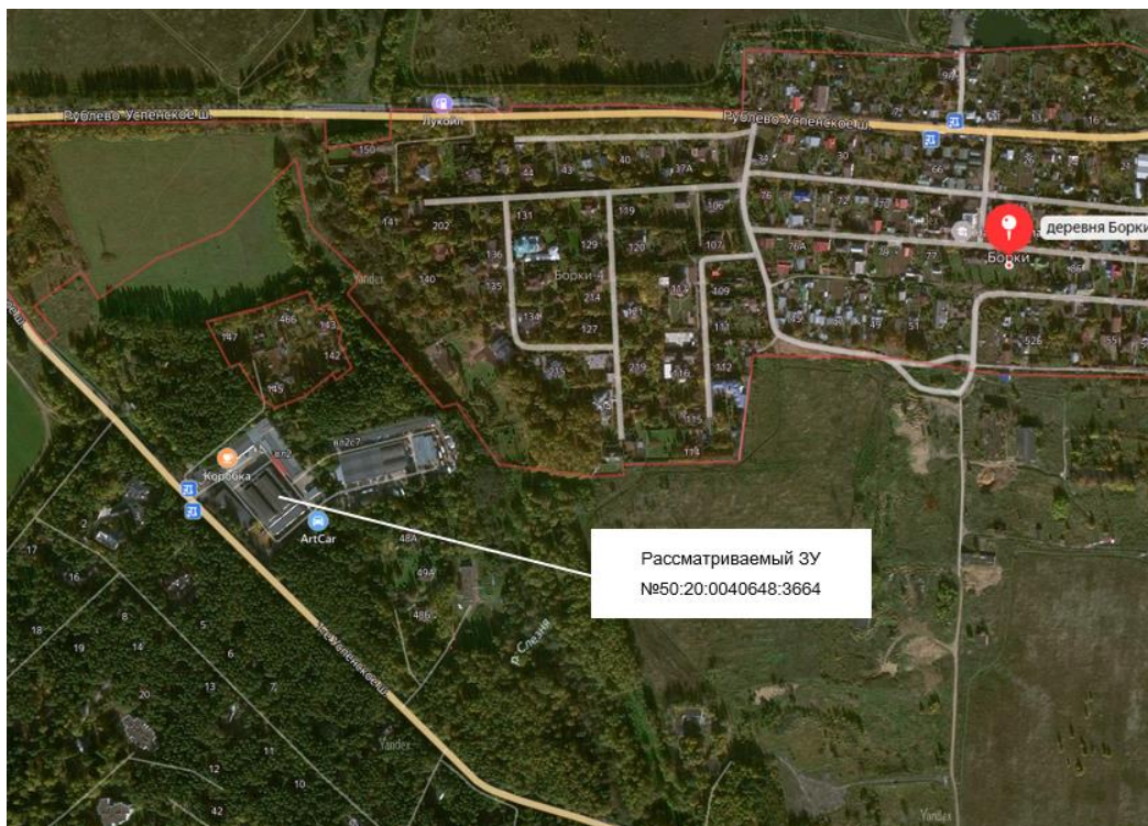
Рисунок 3 - Космоснимок рассматриваемой территории

Космоснимок рассматриваемой территории представлен на рисунке 3.