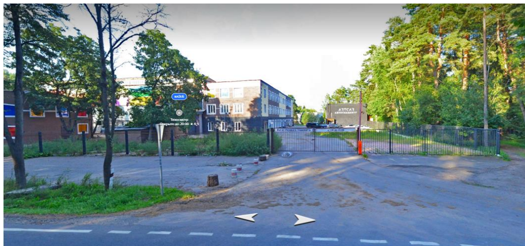
Рисунок 4 - Фотофиксация существующего состояния территории

Фотофиксация существующего состояния территории представлена на рисунке 4.