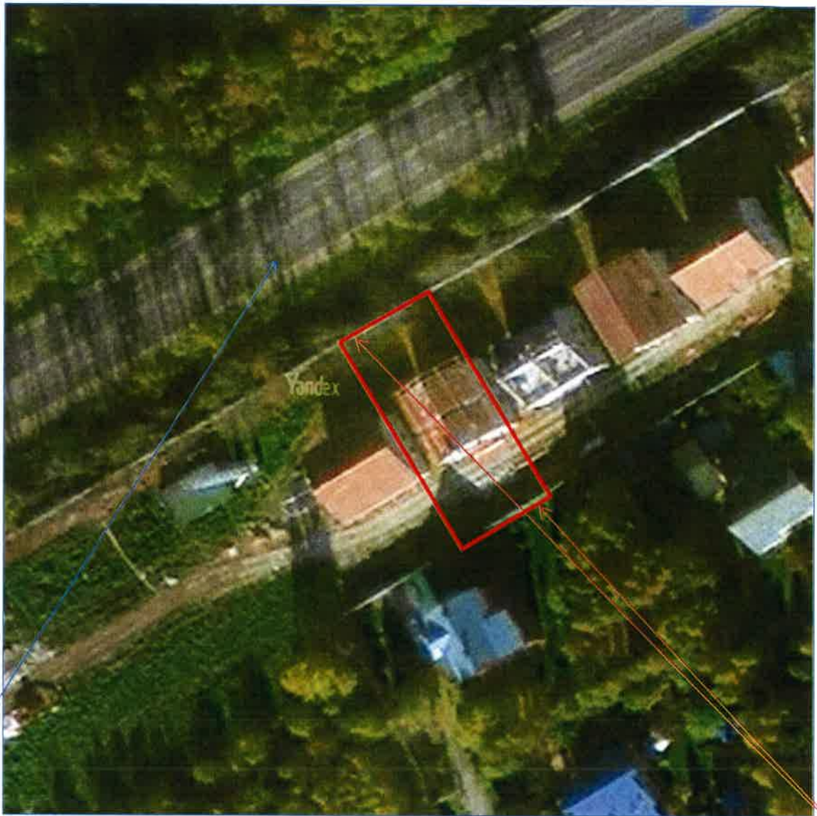
Космоснимок расположения земельного участка и автомобильной дороги, рисунок 5

автомобильная дорога Можайское шоссе (Старая Смоленская дорога, трасса А100)