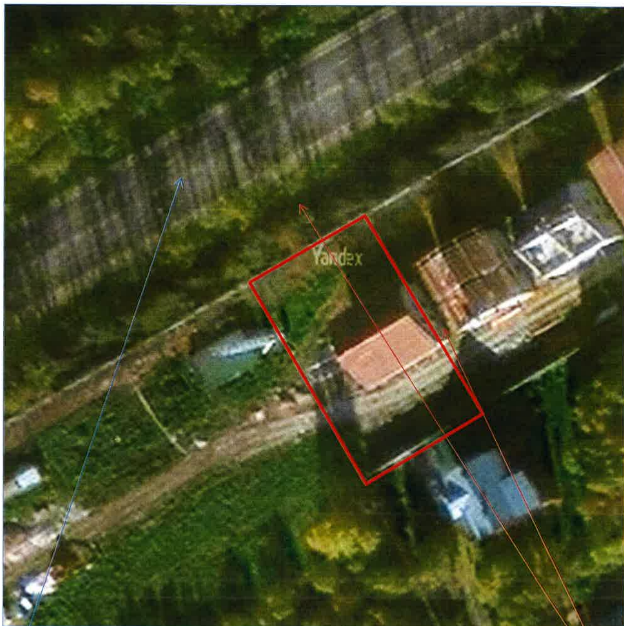
Космоснимок расположения земельного участка и автомобильной дороги, рисунок 5

автомобильная дорога Можайское шоссе (Старая Смоленская дорога, трасса А100)