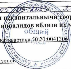
Схема размещения гаражей, являющихся некапитальными сооружениями, стоянок технических или других средств передвижения инвалидов вблизи их места жительства Местоположение/кадастровый №: Московская область, Одинцовский г.о., д. Малые Вяземы, ш. Петровское, кадастровый номер квартала 50:20:0041306 Площадь земельного участка: 3765 кв.м. Категория земель: земли населенных пунктов Вид разрешенного использования: в соответствии с территориальной зоной Обеспечение доступа: земли общего пользования