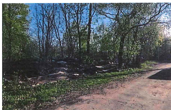
Рисунок 4 – Фотофиксация существующего состояния территории

Земельный участок с кадастровым номером 50:20:0030214:464 имеет категорию земель «Земли населенных пунктов», вид разрешенного использования по правоустанавливающим документам – «гостиничное обслуживание», площадь – 2676 кв. м. В границах земельного участка отсутствуют какие-либо объекты капитального строительства.