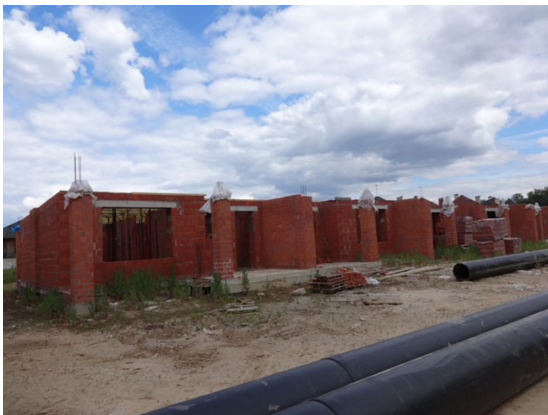
Рисунок 7 – Фотофиксация существующего состояния территории