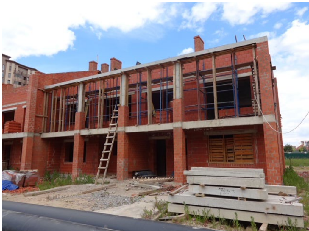
Рисунок 5 – Фотофиксация существующего состояния территории