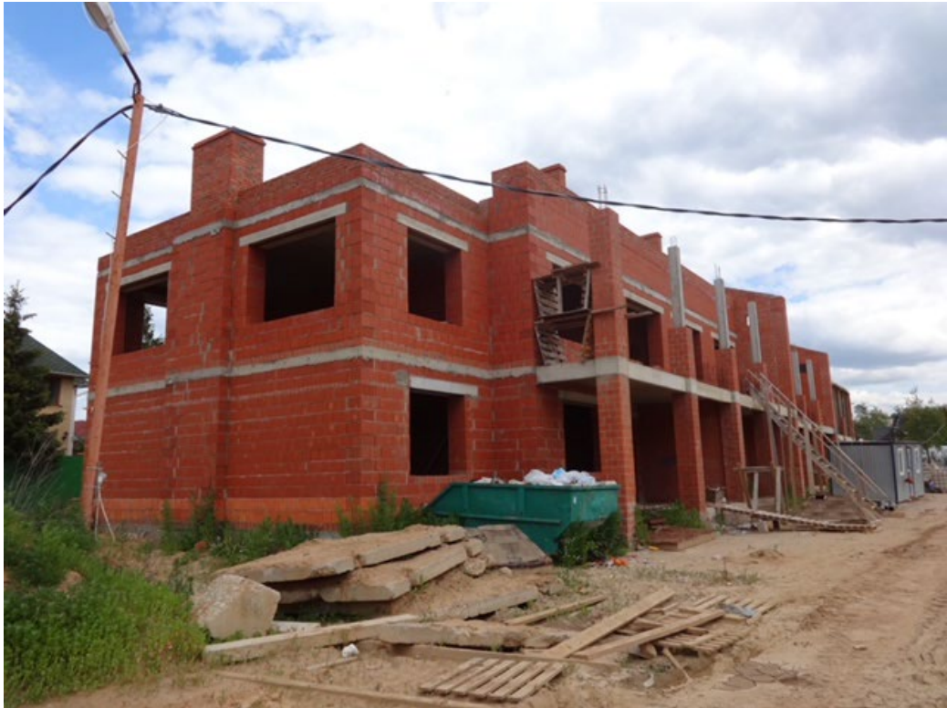
Рисунок 4 – Фотофиксация существующего состояния территории

Фотофиксация существующего состояния территории представлена на рисунках 4, 5, 6, 7.