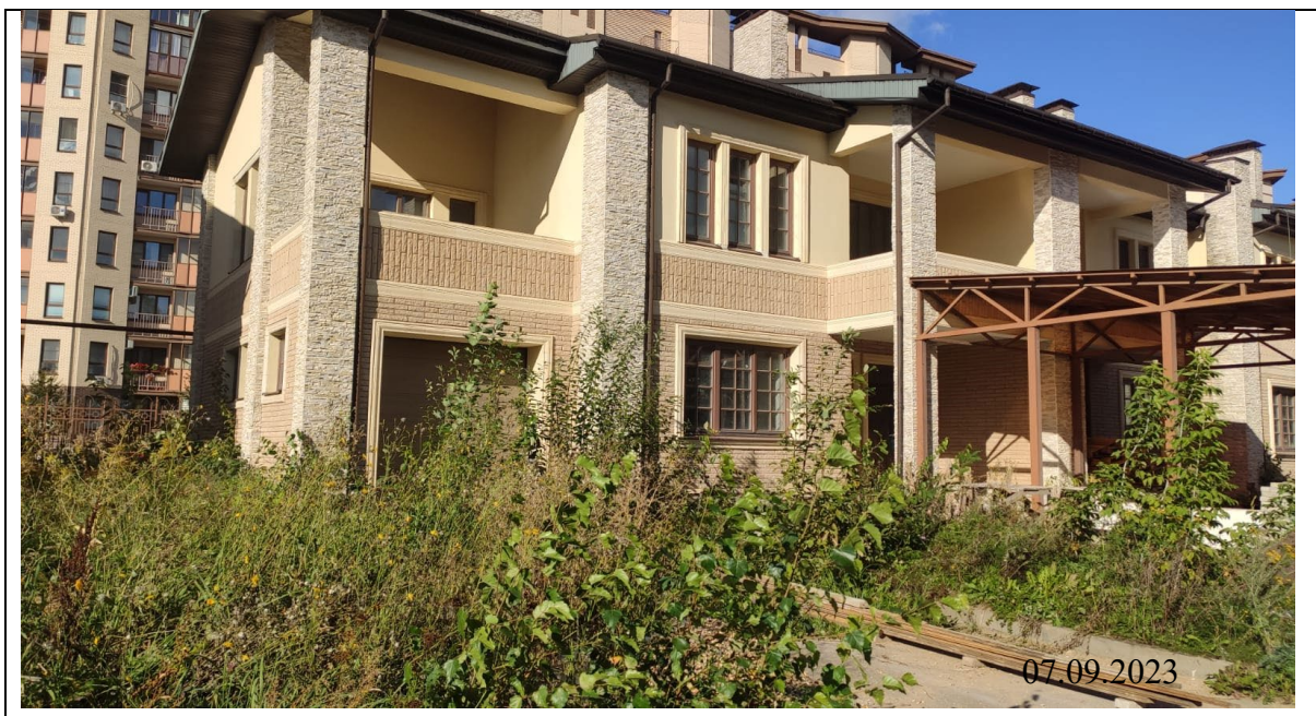
Рисунок 4 – Панорамная фото фиксация местности

Категория земель – земли населенных пунктов. Вид разрешенного использования – для индивидуального жилищного строительства (код 2.1). Условно разрешенный вид использования - Блокированная жилая застройка (код 2.3).