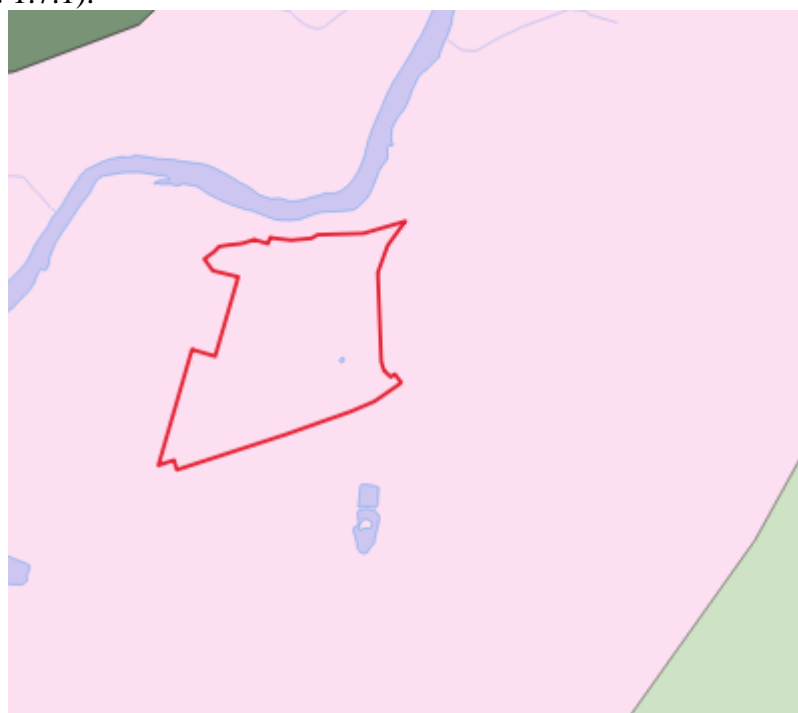
Рисунок 1.7.1. Фрагмент карты изменений геологической среды Московской области (планируемая территория отмечена красным контуром)

По данным региональных геологических исследований (карта изменений геологической среды Московской области, М 1:200 000), устойчивость геологической среды к инженерно-хозяйственному воздействию на территории д. Власово оценивается как низкая (рис. 1.7.1).