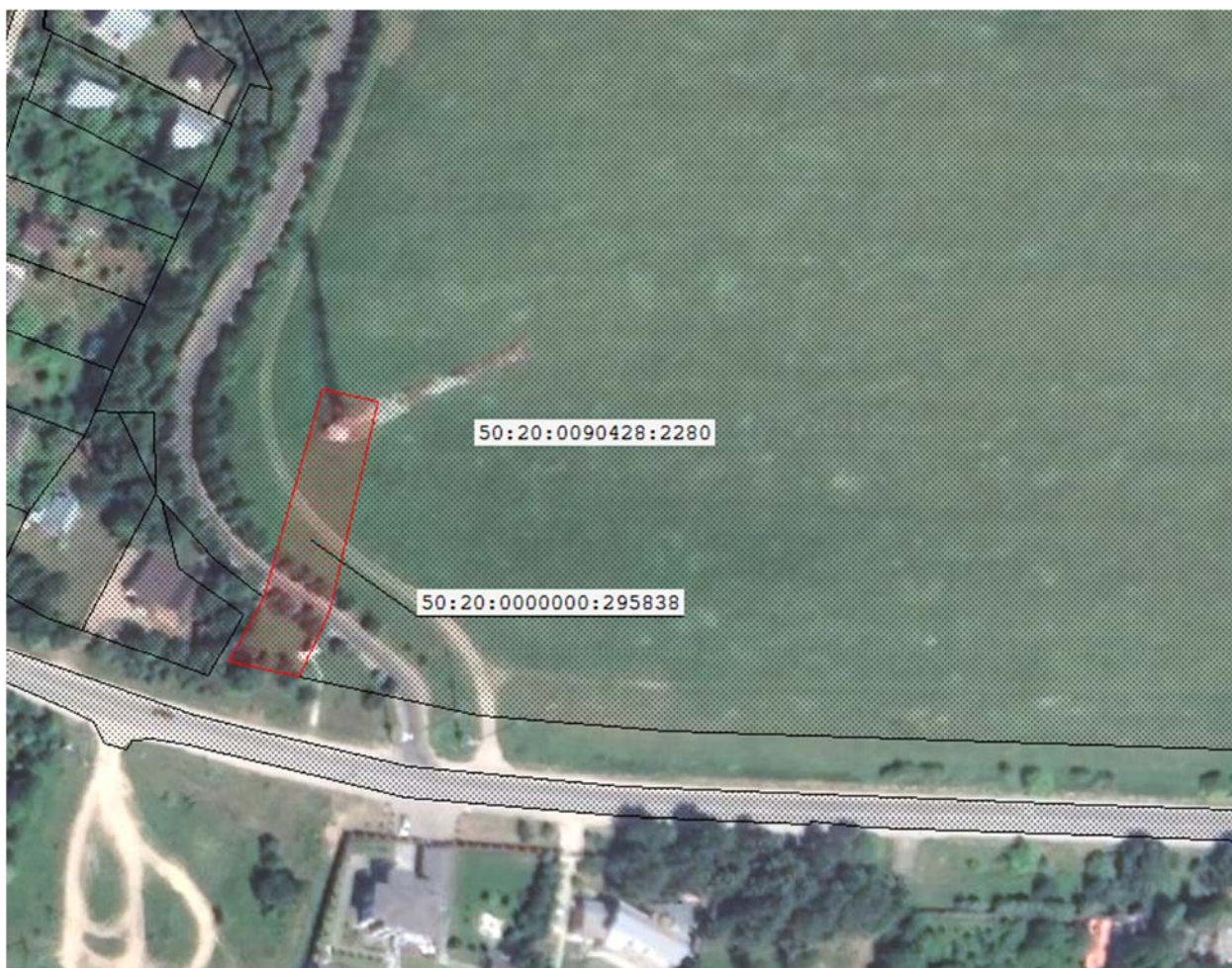
Рисунок 2 – Космоснимок рассматриваемой территории

Космоснимок рассматриваемой территории представлен на рисунке 2.