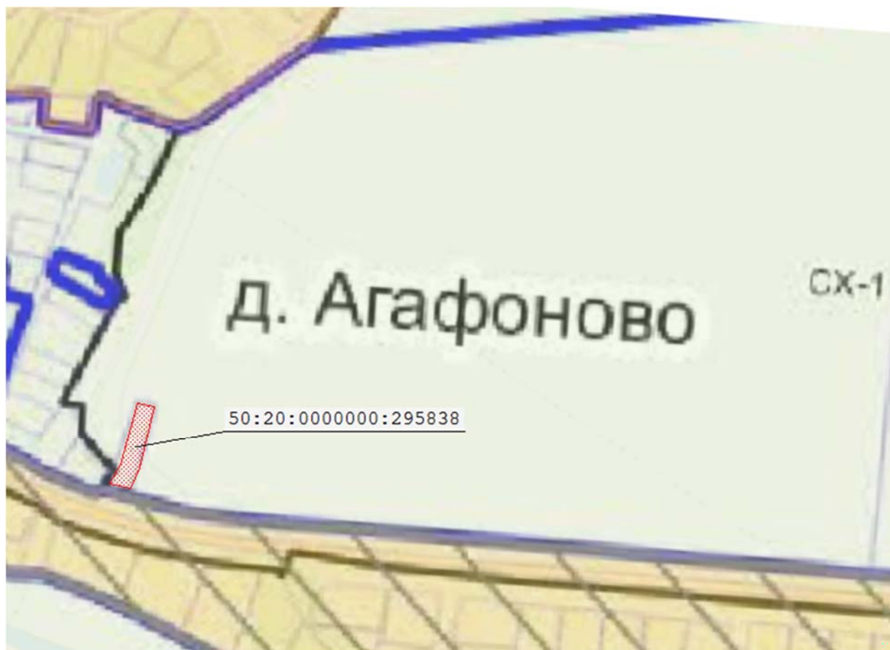
Рисунок 1 – Фрагмент карты градостроительного зонирования городского округа

Фрагмент карты градостроительного зонирования Одинцовского городского округа Московской области в части рассматриваемой территории представлен на рисунке 1.