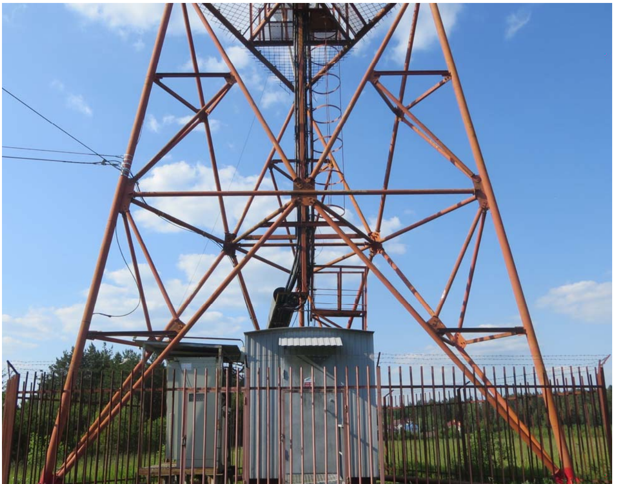
Рисунок 3 – Панорамная фотофиксация местности