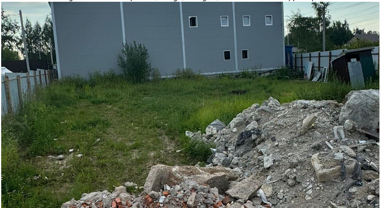
Рисунок 5 – Фотофиксация существующего состояния территории

Земельный участок с кадастровым номером 50:20:0000000:313322 расположен на землях категории «Земли населенных пунктов» с видом разрешенного использования – «Для ведения личного подсобного хозяйства» – площадью 787 м 2 .