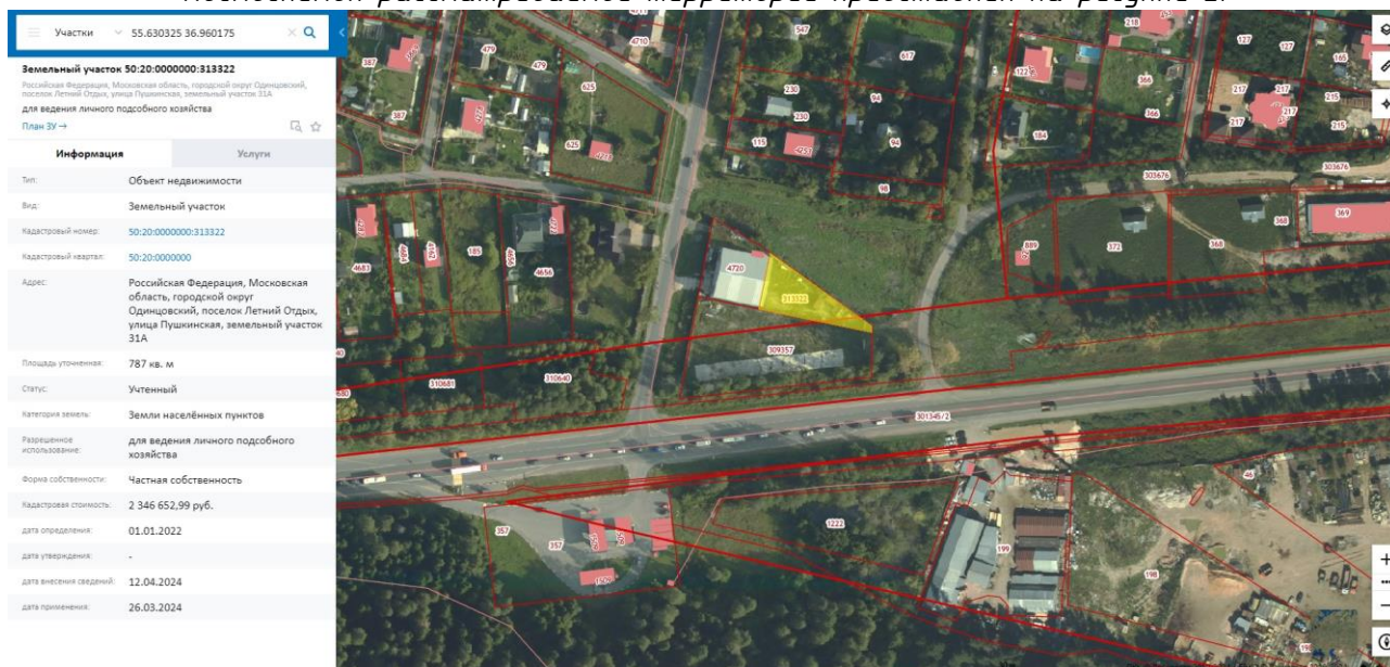
Рисунок 2 – Космоснимок рассматриваемой территории

Космоснимок рассматриваемой территории представлен на рисунке 2.