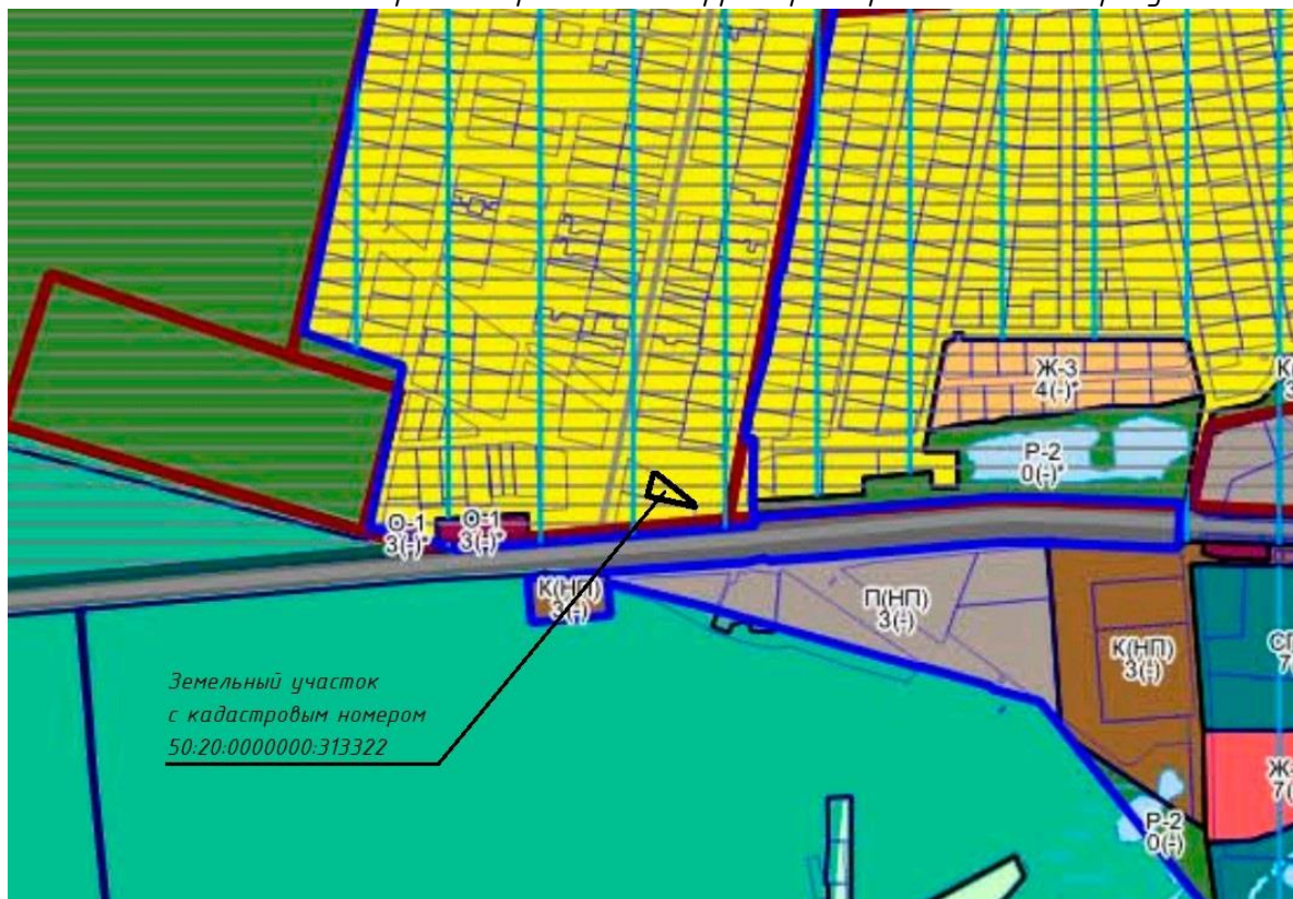
Рисунок 1 – Фрагмент карты градостроительного зонирования Одинцовского городского округа Московской области в части рассматриваемой территории

Фрагмент карты градостроительного зонирования Одинцовского городского округа Московской области в части рассматриваемой территории представлен на рисунке 1.