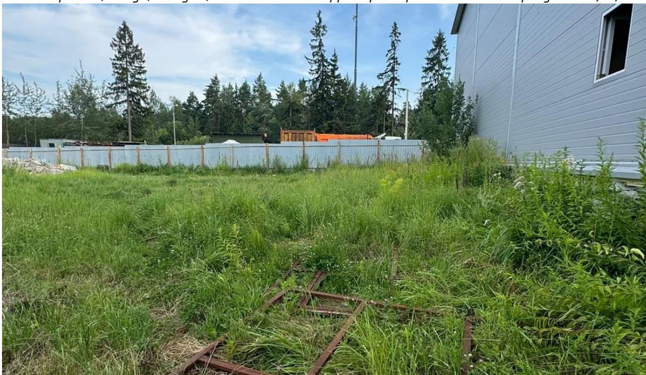
Рисунок 3 – Фотофиксация существующего состояния территории

Фотофиксация существующего состояния территории представлена на рисунках 3, 4, 5