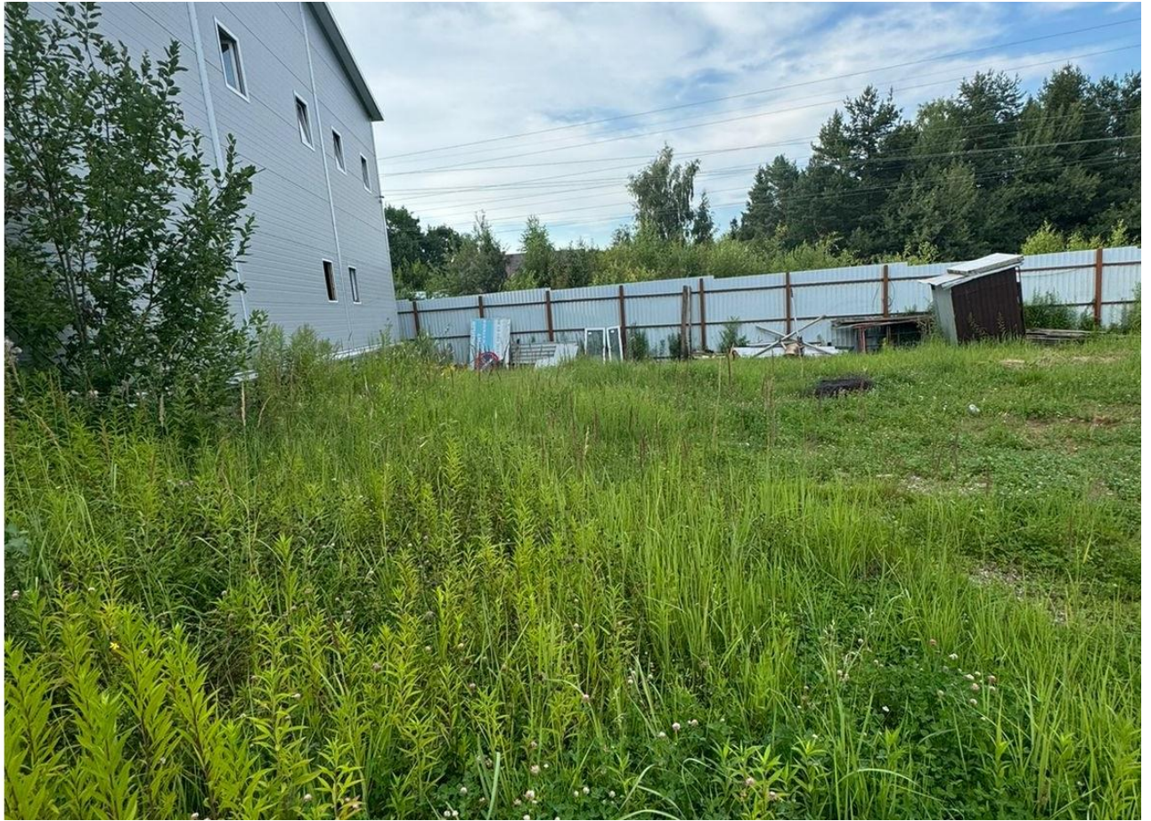
Рисунок 4 – Фотофиксация существующего состояния территории