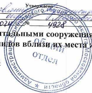
Схема размещения гаражей, являющихся некапитальными сооружениями,

стоянок технических или других средств передвижения инвалидов вблизи их места жительства