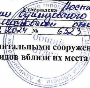
Схема размещения гаражей, являющихся некапитальными сооружениями, стоянок технических или других средств передвижения инвалидов вблизи их места жительства Местоположение/кадастровый №: Московская область, Одинцовский г.о., г. Звенигород, мкр. Первомайский, кадастровый номер квартала 50:49:0010102 Площадь земельного участка: 124 кв.м. Категория земель: земли населенных пунктов Вид разрешенного использования: в соответствии с территориальной зоной Обеспечение доступа: земли общего пользования

Администрация Муниципального округа Истринского городского округа Московской области от 08.10.2024 № 6523