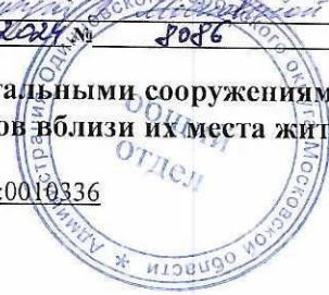
Схема размещения гаражей, являющихся некапитальными сооружениями, стоянок технических или других средств передвижения инвалидов вблизи их места жительства

Местоположение/кадастровый №: Московская область, Одинцовский г.о., г. Одинцово, ул. Говорова, кадастровый номер квартала 50:20:0010336