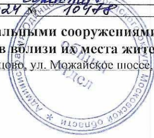
Схема размещения гаражей, являющихся некапитальными сооружениями, стоянок технических или других средств передвижения инвалидов вблизи их места жительства Местоположение/кадастровый №: Московская область, Одинцовский г.о., г. Одинцово, ул. Можайское шоссе, кадастровый номер квартала 50:20:0030105 Площадь земельного участка: 26 кв.м. Категория земель: земли населенных пунктов Вид разрешенного использования: в соответствии с территориальной зоной Обеспечение доступа: земли общего пользования

Администрация Одинцовского городского округа Утверждена Людмила Владимировна от 28.12.2024 № 10478