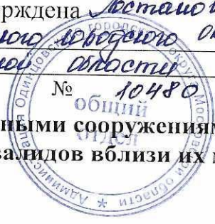
Схема расположения гаражей, являющихся некапитальными сооружениями, стоянок технических или других средств передвижения инвалидов вблизи их места жительства

Утверждена Летановскими Администрацией Одинцовского городского округа Московской области от 28.12.2024 № 10480