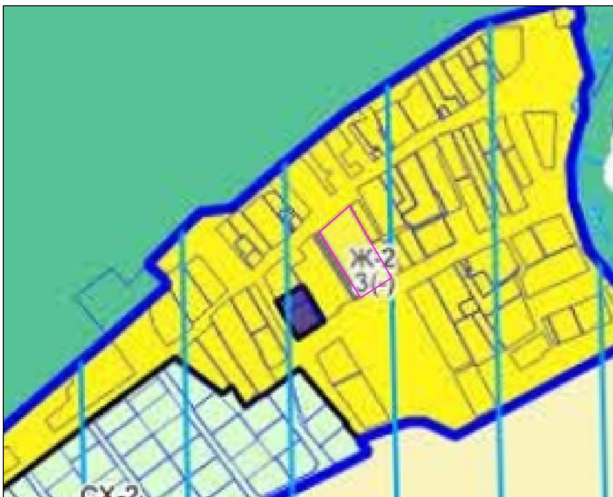
Рисунок 1 – Фрагмент карты градостроительного зонирования городского округа

Фрагмент карты градостроительного зонирования Одинцовского городского округа Московской области в части рассматриваемой территории представлен на рисунке 1.