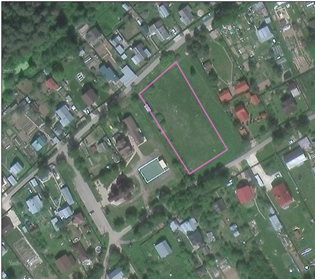
Рисунок 2 – Космоснимок рассматриваемой территории

Космоснимок рассматриваемой территории представлен на рисунке 2.