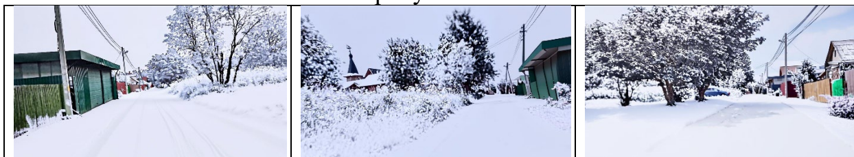
Рисунок 3 – Панорамная фотофиксация местности (дата съемки 26.12.2025)

Фотофиксация существующего состояния территории представлена на рисунке 3.