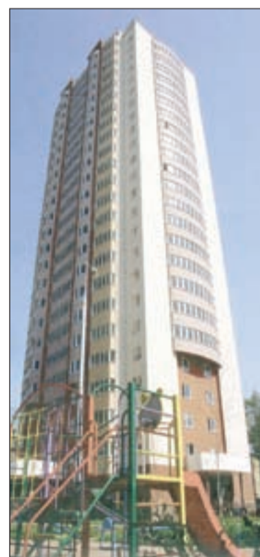
ЗАО «МОИСК», заслуженный строитель Российской Федерации