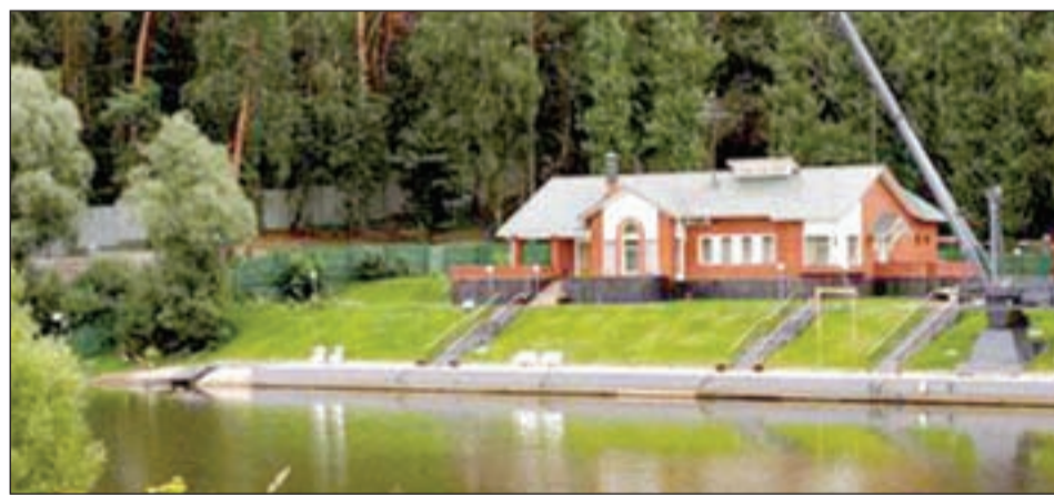
• Спуск к Москве-реке и лодочному пирсу.

Подготовил Николай МИТРОНОВ.