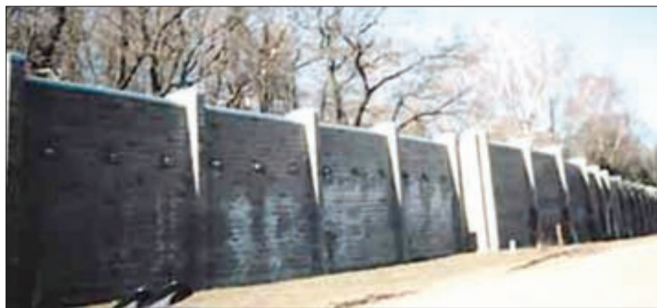
• Покой резиденции охраняет надёжная кирпичная стена.