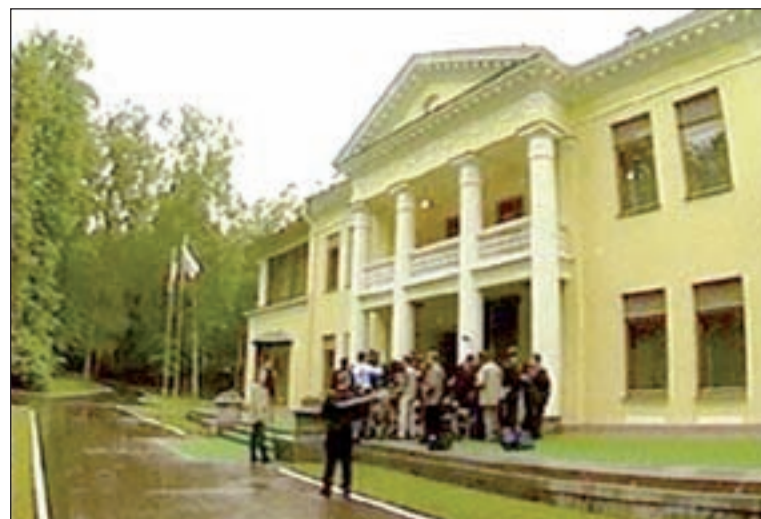
• Резиденция президента в Ново-Огарёве.

После смещения в конце 1991 года Горбачева с поста Президента СССР, его преемнику, президенту «новой» страны Б. Н. Ельцину предложили госдачу в Барвихе-4. Место Борису Николаевичу понравилось. Более шестидесяти гектаров огороженной территории, специальный отвод Москвы-реки с плотиной и прудом, где рыба ловится на голый крючок, детские площадки, сады, вольтер для собак. Здесь же — теннисный корт и тренажерный зал. «Но когда Ельцин посетил Старое Огарево, где Горбачев построил представительскую дачу (загородная резиденция Михаила Сергеевича располагалась в Ново-Огареве), — писал в своих воспоминаниях «С ельцинским размахом» А. В. Коржаков, — Борису Николаевичу захотелось именно туда. Там, правда, не было ни детских площадок, ни теннисного корта, да и баня маловата. Тем не менее, в соответствии с Указом Президента России Барвиха-4 была объявлена резиденцией для высоких иностранных гостей, прибывающих в гости к «самому», а Старое Огарево — напротив — объявлялось его личной резиденцией. Но семья президента оказалась туда переезжать, об указе забыли и, кажется, даже не отменили».