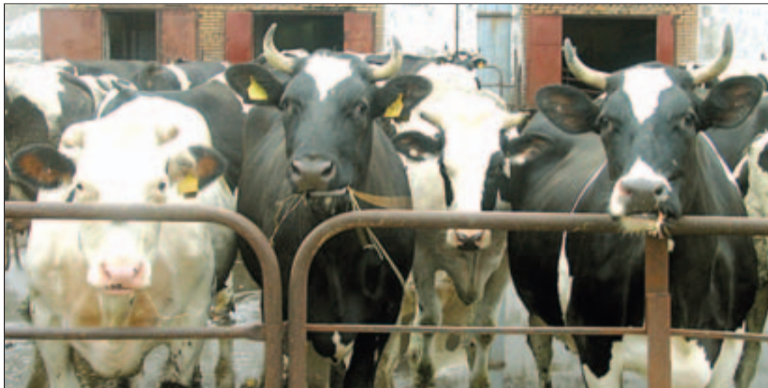
• Бурёнки в хозяйствах нашего района здоровы.

вакцинация против бешенства собак и кошек.