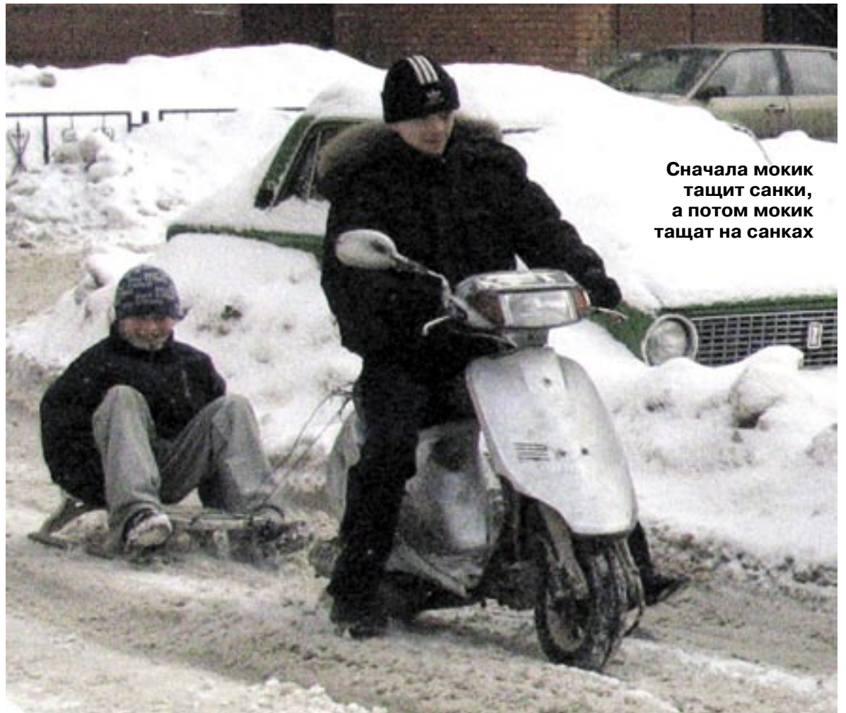
Сначала мокик тащит санки, а потом мокик тащат на санках