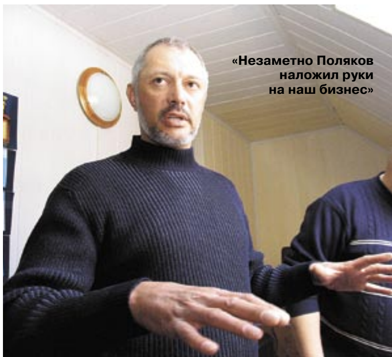
«Незаметно Поляков наложил руки на наш бизнес»

Кого и чего только нет в этой истории! Народные артистки СССР и их мужья - народные самородки. Советники бывшего Президента России и высокопоставленные сотрудники администрации его преемника. Будущие президенты Армении, временно подрабатывающие на рынке, и генералы госбезопасности, похожие на известных «катал» из бань на Власихе. Реальные генералы МВД, еще более реальные солнцевские бригадиры и элитные бойцы «Витязя» - временно безработные с тверской пропиской. Разборки и загрузки, наезды и накаты, заявления в милицию, обращения в суд и чисто конкретные обещания «башка отстрелить».