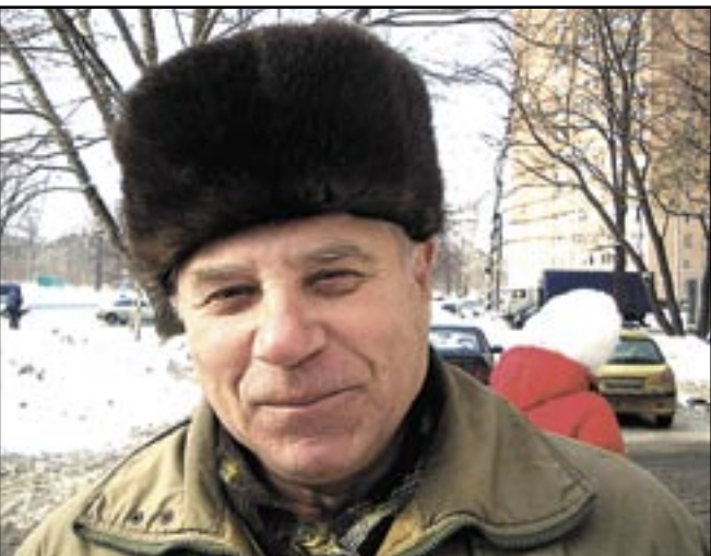
Василий Алексеевич, пенсионер: - Скорее, правильно.