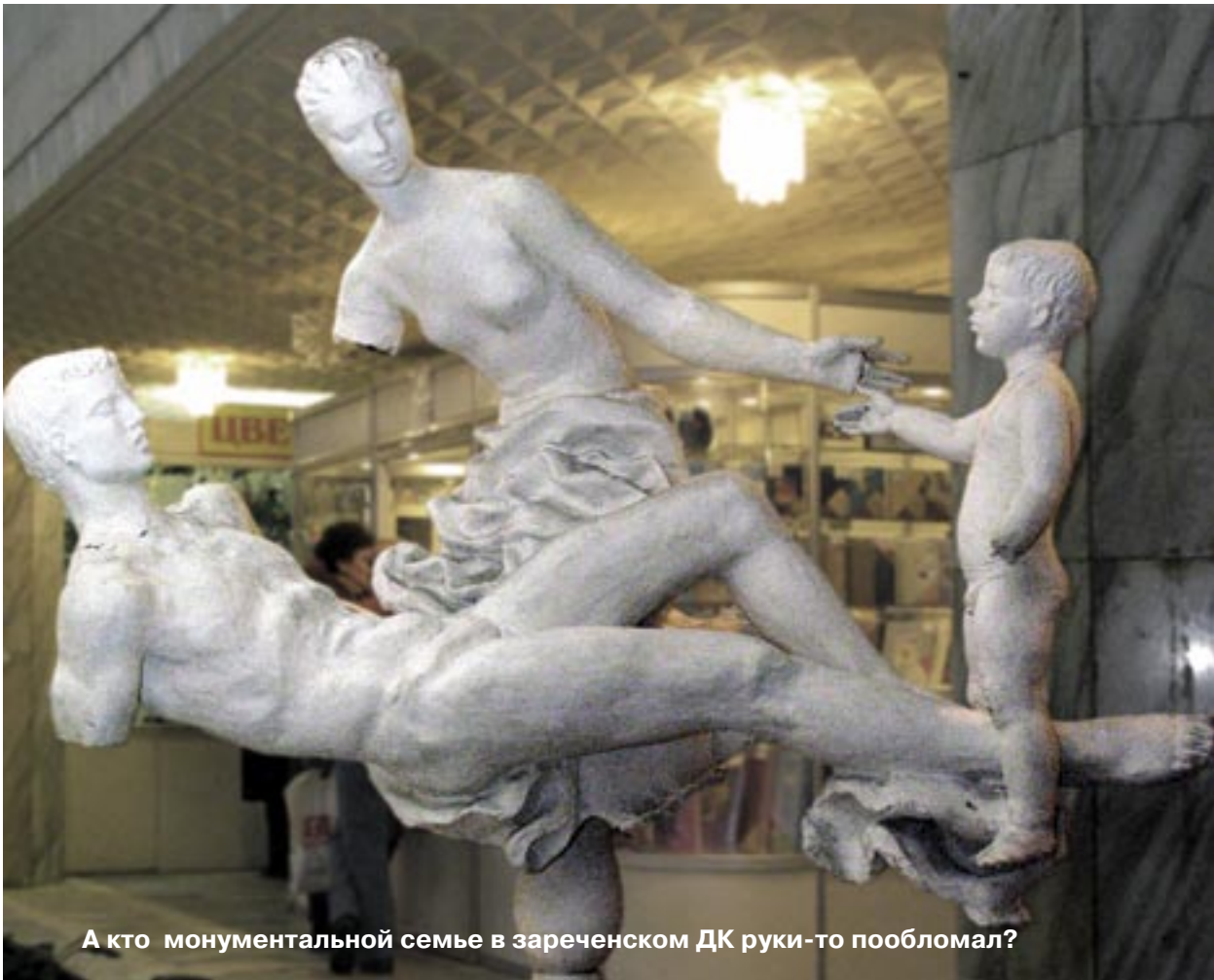
А кто монументальной семье в зареченском ДК руки-то пообломал?

Пока одни в Заречье трое суток почти пробивали занесенную снегом дорогу к «мамоновским хutorьянам», другие собирались то ли на общепоселковый сход, то ли на митинг, то ли просто «пар выпустить» по треклятой жилищно-коммунальной теме. И те, и другие встретились под противным холодным дождем в субботу 26 марта в самом центре новоиспеченного ПГТ (поселка городского типа). Народ был полон решимости мокнуть и мерзнуть у конторы ЗАО «Заречье» им. С.А. Кушнарева: «Здесь хоть покричим вдоволь, и слышать все будут, кто рядом живет и мимо идет, - с незатейливой искренностью сказала очень по-столичному одетая «совхозная» дама. - Пусть им стыдно, наконец-то, станет!»