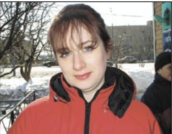
Оксана: - Как правило, я не обращаю внимание на маркировку на продуктах. Для меня не принципиально - «ГОСТовская продукция» или «ТУ-шная»