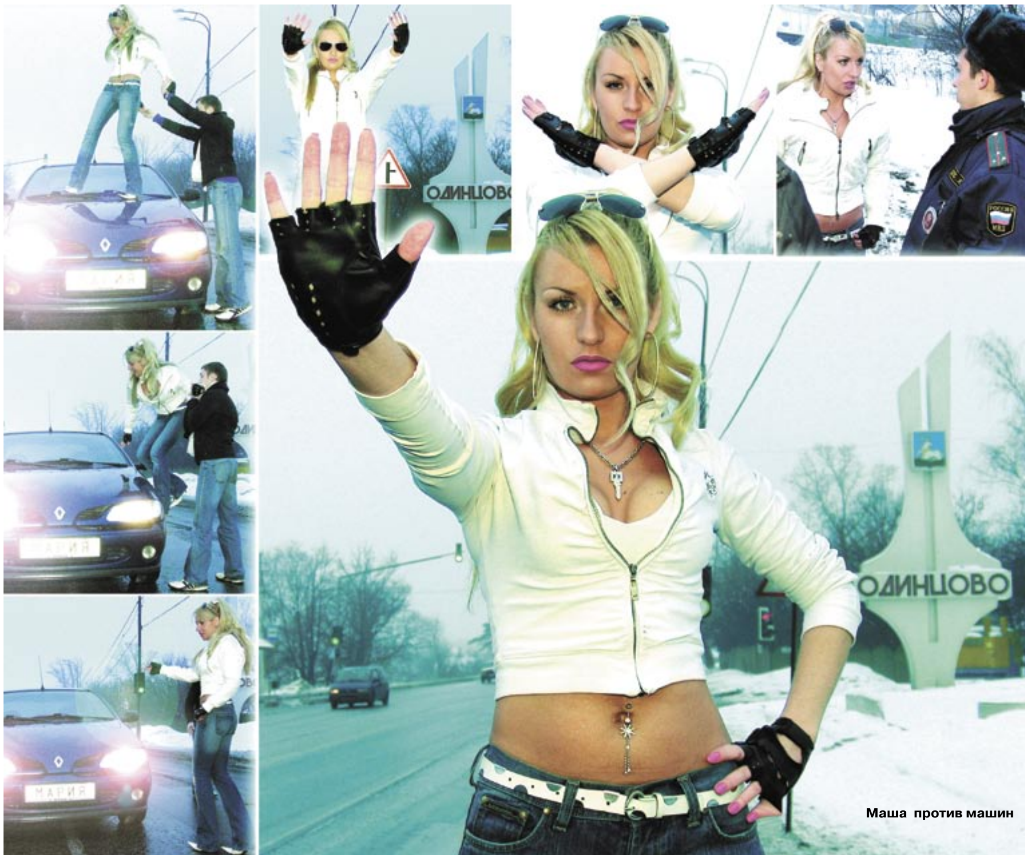
Маша против машин