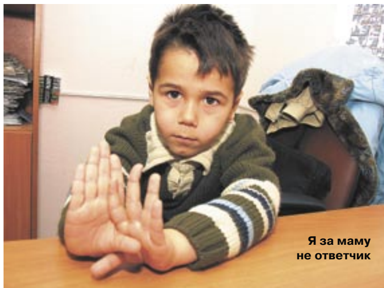
Я за маму не ответчик

Вот как изложила «НЕДЕЛЕ» свое видение ситуации сама молодая мама: