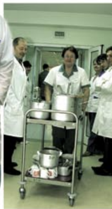
А все думали, что фурсшет...