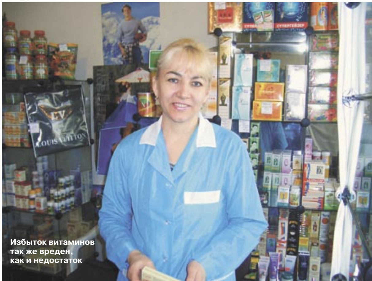
Избыток витаминов так же вреден, как и недостаток

Сегодня очень много говорится о пользе витаминов, некоторые врачи даже утверждают, что у подростка, который не страдает от их недостатка, гораздо меньше шансов стать наркоманом, чем у детей, испытывающих «витаминный голод». Однако помните, что избыток витаминов также может повлечь за собой самые неприятные побочные эффекты. Не забывайте древнюю истину: «Всё - яд, и всё - лекарство. Дело только в дозе».