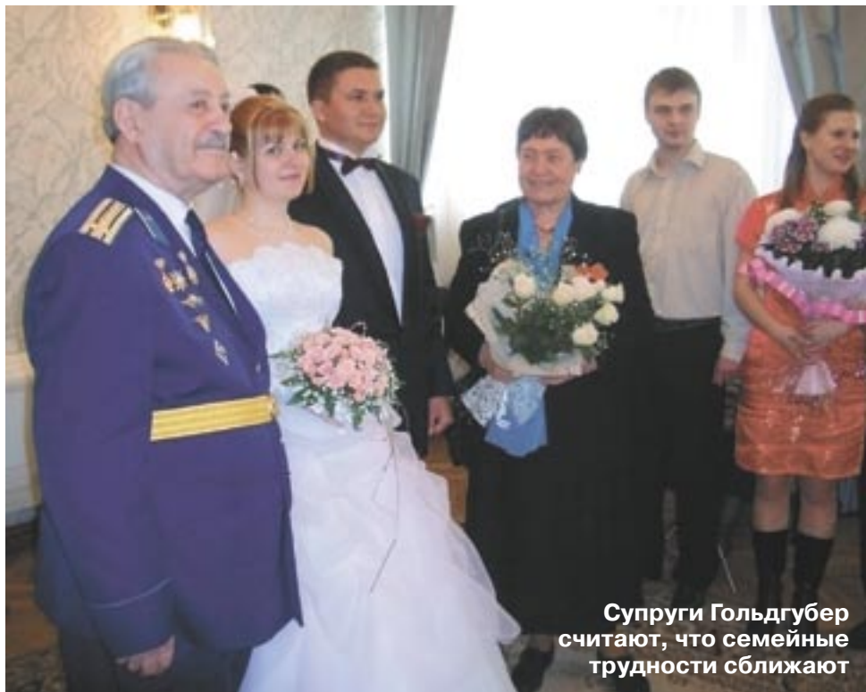
Супруги Гольдгубер считают, что семейные трудности сближают