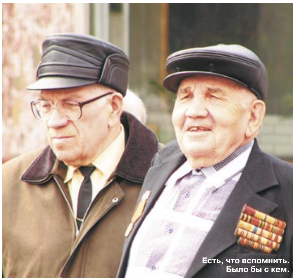
Есть, что вспомнить. Было бы с кем.