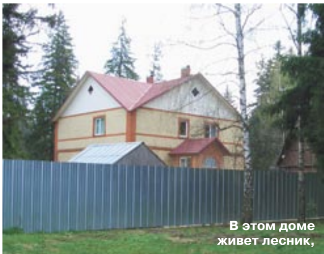
В этом доме живет лесник,

правда приехать за ними придется ещё какое-то время спустя».