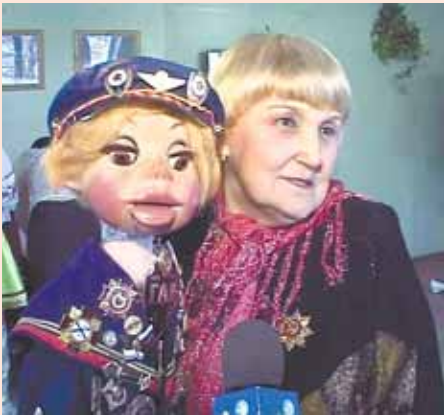
Народная артистка России Раиса Виноградова с куклой Кирюшей. Талант актрисы настолько неординарен, что её имя дважды занесено в книгу рекордов Гиннеса.