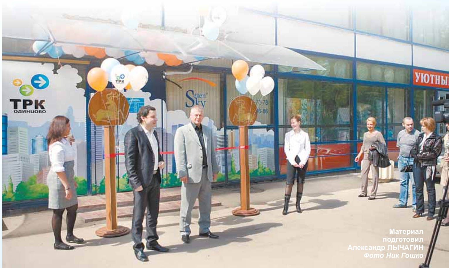
Материал подготовил Александр ЛЫЧАГИН