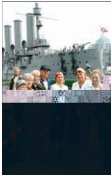
• «Одинцовские самоцветы» на фоне знаменитого крейсера «Аврора» и у памятника Петру I.