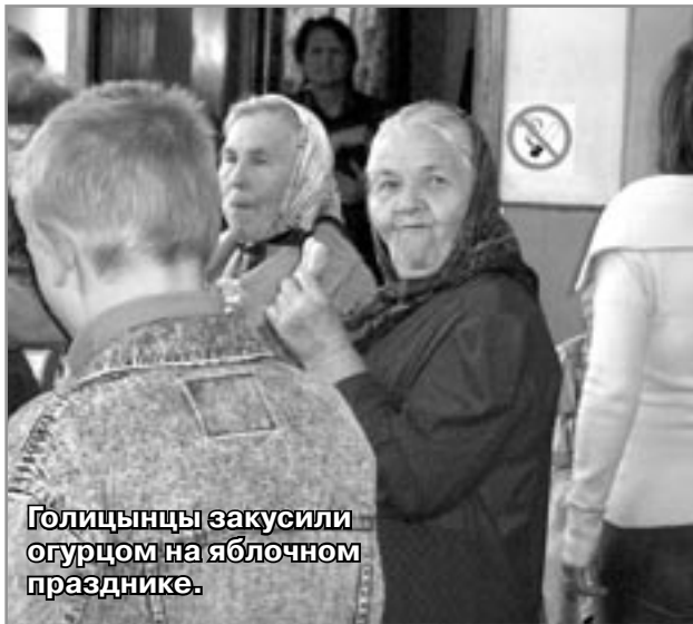
Голицынцы закусили огурцом на яблочном празднике.