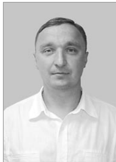
Оплачено из избирательного фонда кандидата в депутаты Совета депутатов муниципального образования г. п. Кубинка по 1-му избир. округу