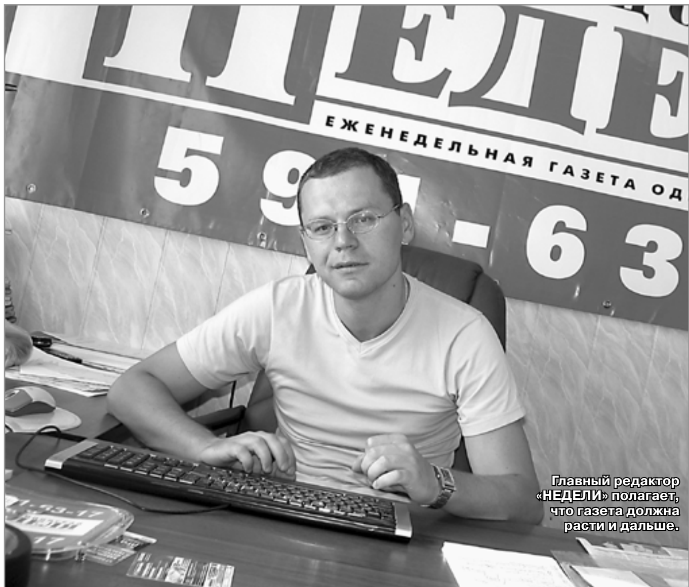
Главный редактор «НЕДЕЛИ» полагает, что газета должна расти и дальше.