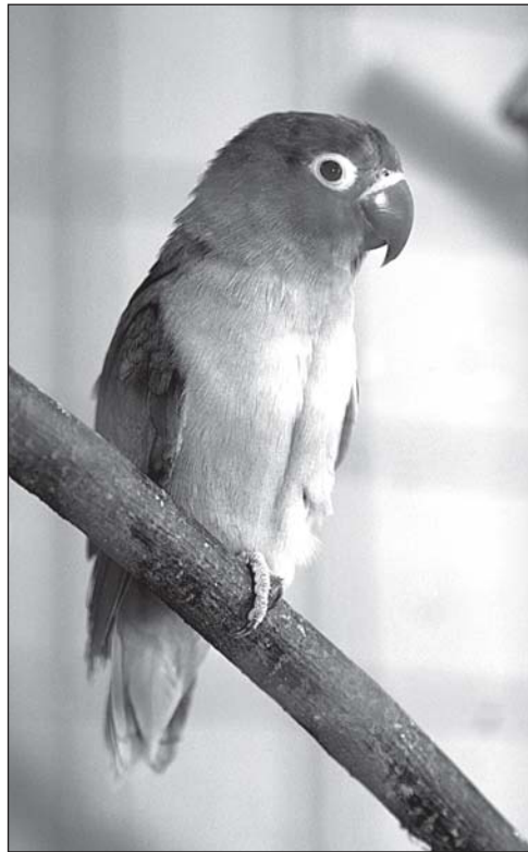
• И такая птичка есть на «Птичке».