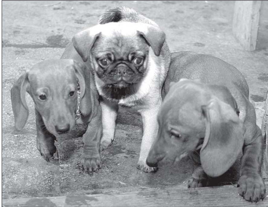
• «Где же ты, хозяин и друг? Мы ждем тебя».