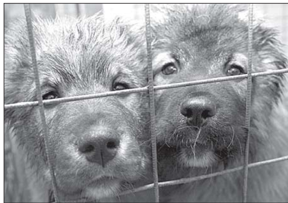
• Давай знакомиться!