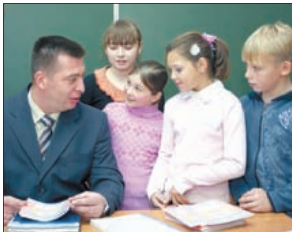
• Беседовать со школьниками — совсем не просто.