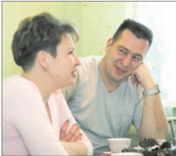
• Семейный разговор.