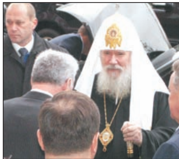
• Его Святейшество в дни празднования 50-летия города Одинцово, когда освящался собор Святого Георгия Победоносца.

Патриарх жил и скончался по соседству с Одинцовским районом в Переделкине. Много раз он бывал в наших храмах. Освящал храм Преподобного Илии Муромца на Власихе, Троицкий храм в селе Ершово, крестил ковчегом с мощами преподобного Саввы Сторожевского прихожан храма Гребневской Иконы Божией Матери, присутствовал при открытии собора Святого Георгия Победоносца в Одинцове немногим более года назад. Алексей II не раз отмечал, что в нашем крае много делается, чтобы восстановить веру в Бога, а вместе с ней веру в чистоту души,