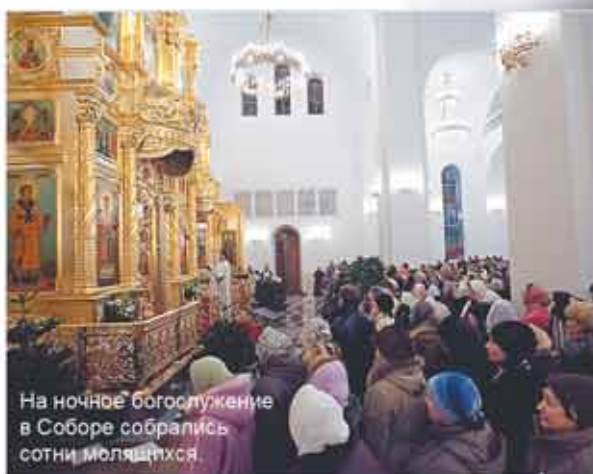
На ночное богослужение в Соборе собрались сотни молящихся.