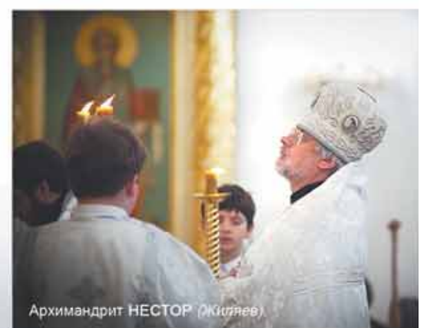
Архимандрит НЕСТОР (Житяев)