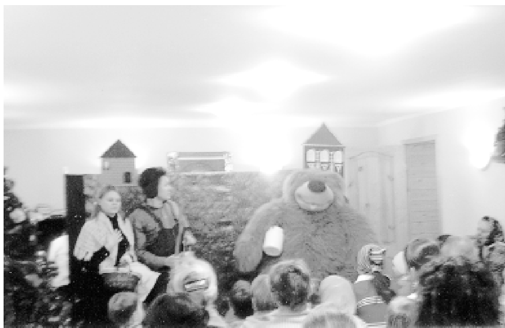
• Детский Рождественский праздник в Перхушково.

Радостно и светло прошёл престольный праздник Рождества Христова в Христорождественском храме села Немчиновка. Служили Сочельник - навечерие Рождества, торжественная Всенощная. Прихожане храма уже давно радуются трехголосному пению хора, настоящим подарком было трехголосное исполнение рождественских колядок за праздничной трапезой. На само