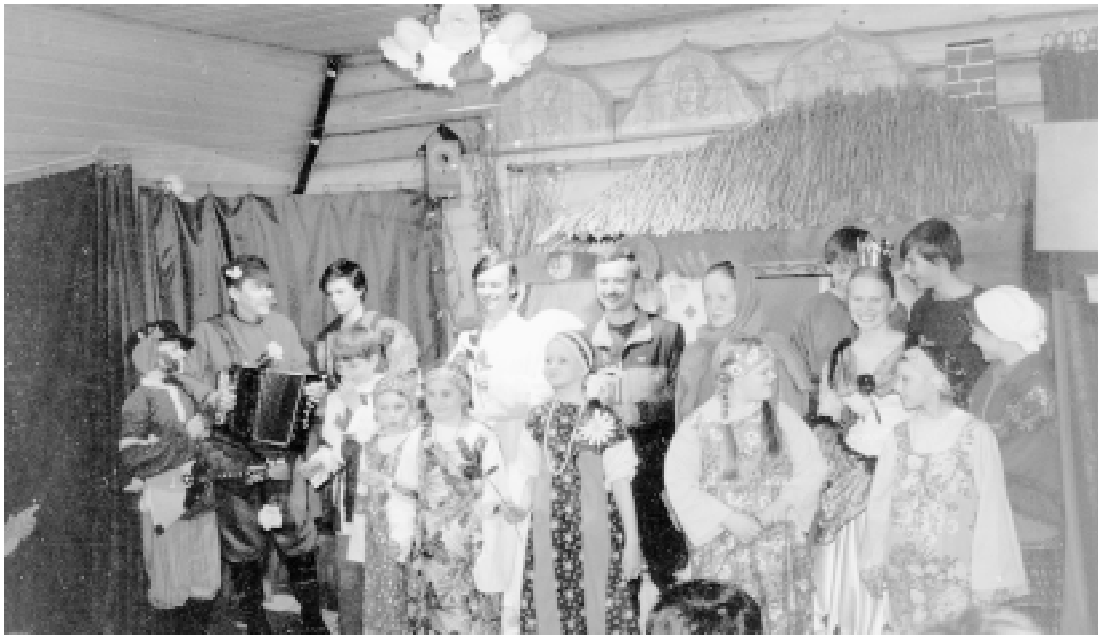
• Вот уже девять лет с начала восстановления храма в честь Рождества Христова в Барвихе здесь празднуют престольный праздник.