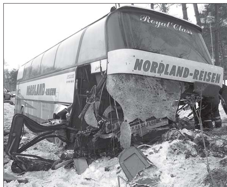
Подготовила Настя ЧИЧКОВА.

«Новые рубежи» довольно часто публикуют на своих страницах «устные» сообщения о дорожно-транспортных происшествиях. В сегодняшнем номере к скучным строчкам об авариях на дорогах прилагаем «наглядный» материал. Как говорится, лучше один раз увидеть... Жуткое зрелище... Соблюдайте правила дорожного движения, будьте внимательны за рулем, и путь к нужному месту назначения не приведет вас к концу жизни.