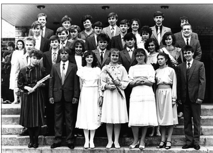
• Такими мы были в июне 1986...

20 лет прошло с той поры, как ученики вышли во взрослую, самостоятельную жизнь. И многие действительно впервые увидели своих одноклассниц и одноклассников за это немалое время. Собрался почти весь 10-б класс, даже те, кто не смог прийти, все равно были вместе в рассказах и в воспоминаниях. С огромным уважением и словами неизмеримой бла-