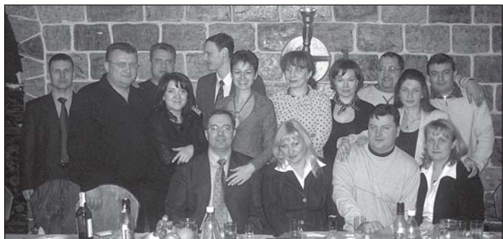
• ...Такие мы в феврале 2006 года.