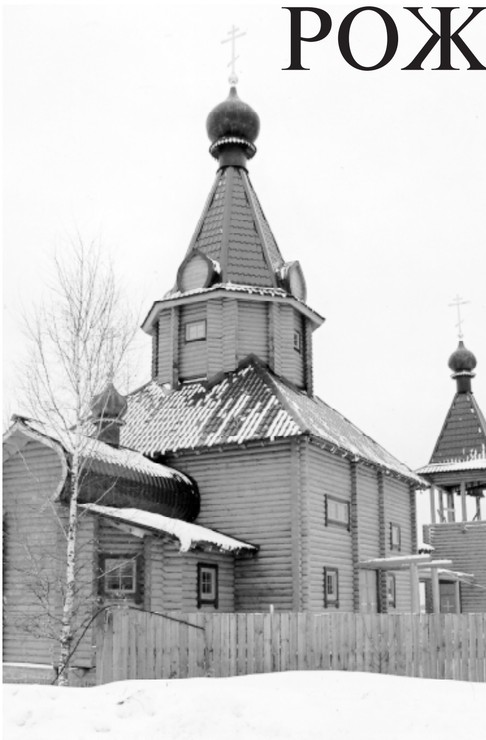
• Троицкая церковь в селе Козино: на последней неделе Рождественского поста в новом храме велись строительно-монтажные работы, сборка иконостаса и оформление внутреннего убранства храма.