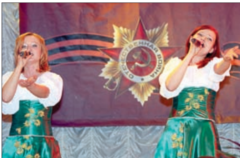
• Солистки группы «Тиана» Саввинского Дома культуры «Юбилейный».