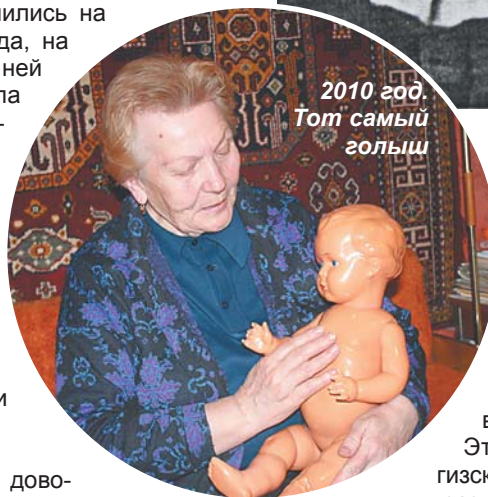
2010 год. Тот самый голыш

лакомством, хотя это же просто спрессованная шелуха от подсолнечных семечек, слегка масляная. Равовались и оладушкам из картофельных очистков.