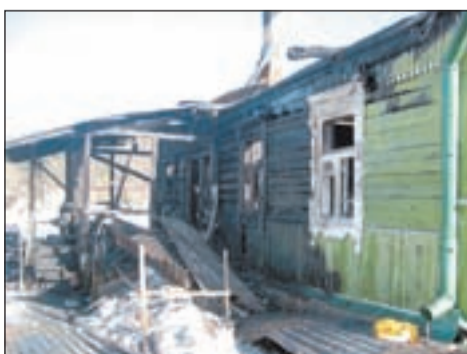
ОГПН по Одинцовскому муниципальному району.

Сейчас сотрудники Госпожнадзора устанавливают причины возникновения пожара, приведшего к гибели человека.