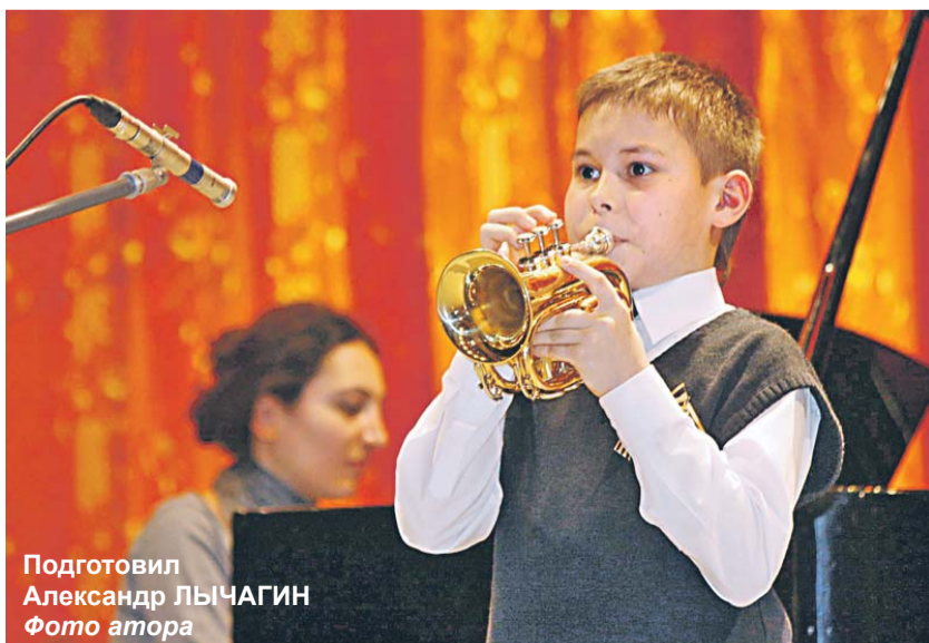
Подготовил Александр ЛЫЧАГИН